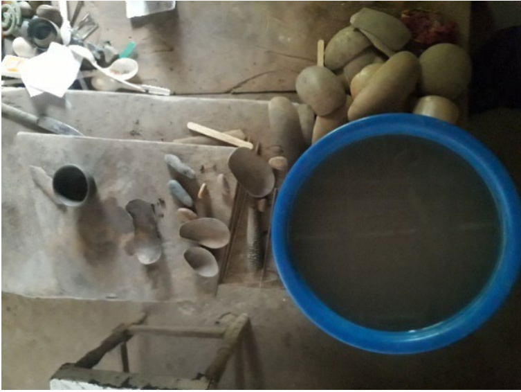
Fotografía 19. Mesa de trabajo de Eduardo Sandoval.