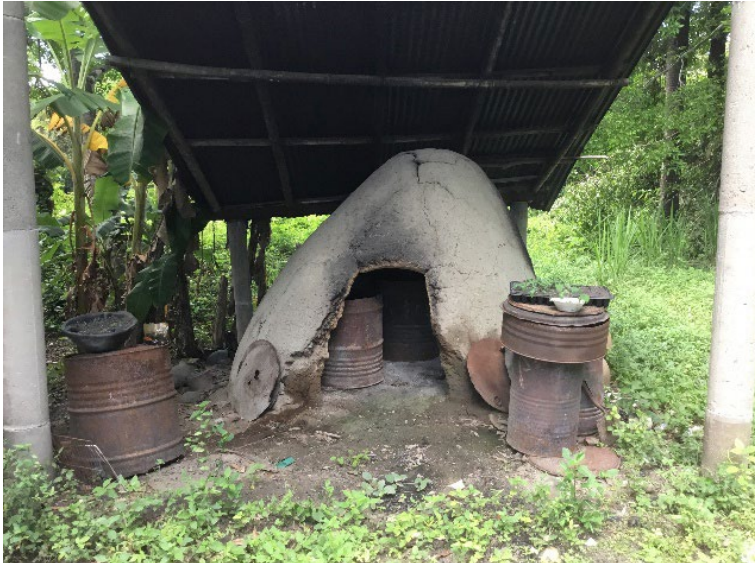
Fotografía 55. El aprendizaje de Ortiz.