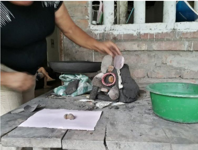
Fotografía 20. Mesa de trabajo de Nelly Guzmán Cabezas.