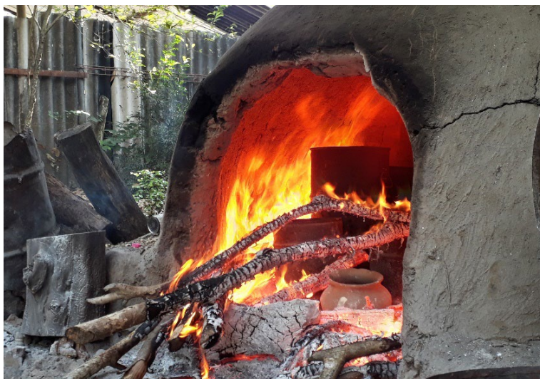
Fotografía 42. Horno de leña.