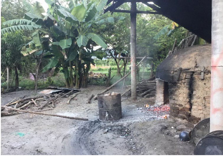
Fotografía 40. Empujar con vara canecas al horno en ladrillo.