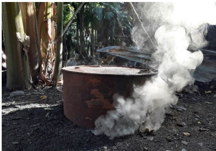
Fotografía 47. Ahumado.