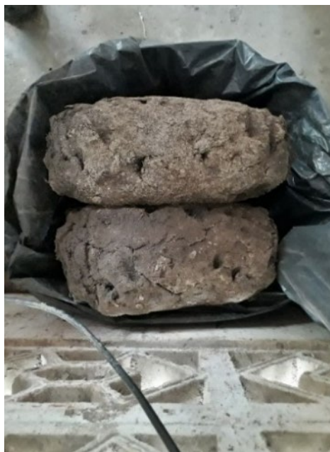
Fotografía 16. Pelotas de barro.