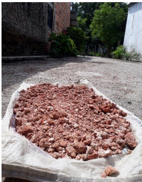
Fotografía 7. Barro rojo seco.