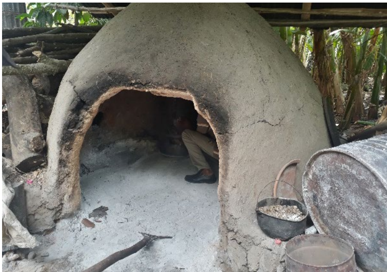
Fotografía 41. Don Libardo acomoda canecas dentro del horno de barro.