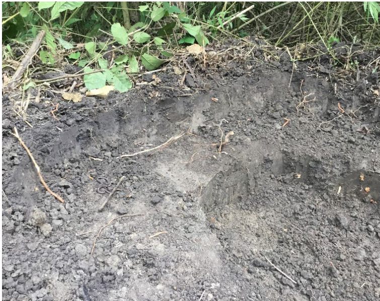
Fotografía 5. El corte que sigue la veta.

Las minas públicas no son las únicas. En algunas fincas las personas sacan su propio barro en pequeñas cantidades, pero no es usual porque no quieren tener huecos en su propiedad. En las haciendas arroceras contiguas al centro poblado algunos hacendados permiten sacar barro en épocas previas a la siembra, pero hay quienes “roban” de esas fincas el barro. Esto era más usual en el otro tiempo , el tiempo de antes , o de la gente antigua , o de los viejos antiguos , de los padres o los abuelos de mis maestras. Carmen Rosa Avilés, famosa artesana ya retirada, recuerda cuando tuvo que meterse en su juventud a robar unos puchos de barro a una finca y el dueño llegó a sacarla a ella y a su amiga a machete. Ella, “muy guapa”, se enfrentó al hombre blandiendo el barretón en defensa y alegando que lo hacía para trabajar.