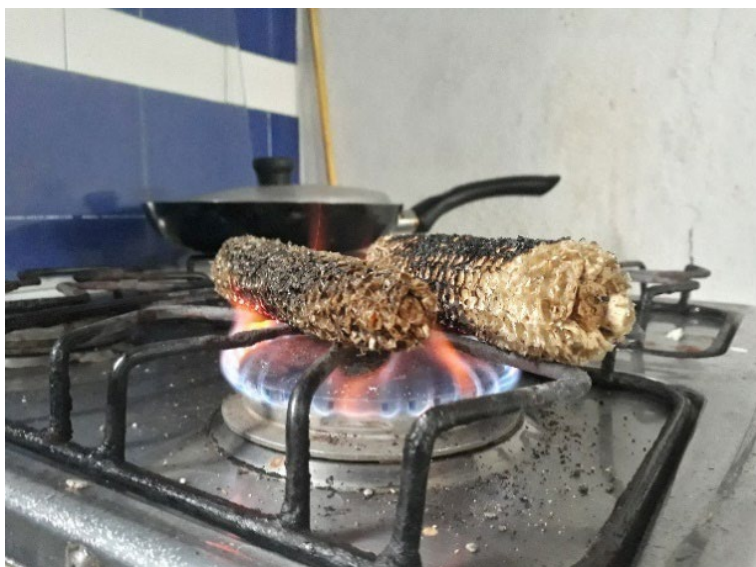
Fotografía 27. La preparación de la tusa.

Subir también es armar la obra, por eso cuando se daña irreparablemente por cualquier motivo antes del horno prefieren desarmarla , reutilizar el barro, o el daño mismo cuando es grave, como causado por el agua lluvia, es motivo para decir que la obra se desarmó o desbarató . Es armar porque sobre la base, cubriendo el borde, ponen una yota a la vez, uniéndola al cuerpo de la obra hasta alcanzar la altura y la forma deseada. Con una tusa de maíz borran la unión: una mano pasa la tusa por dentro y por fuera y la otra mano sostiene con fuerza el lado opuesto para evitar daños. Las tusas salen de la enorme producción de maíz que rodea a La Chamba, de las cuales las toman, desgranadas, de cualquier tamaño que necesiten. Tienen de diferentes longitudes y calibres para cada tipo de pieza y las pasan por el fuego para dejar únicamente las estrías, con las cuales se “saca el aire” de las paredes y las “empareja”. Tras la tusa pasan la cuchara y borran la huella de la tusa. Así con cada yota. Después de subir con dos o tres yotas hay que esperar a que dé punto de nuevo, porque el barro está muy blando y debe endurecerse para que no se desarme.