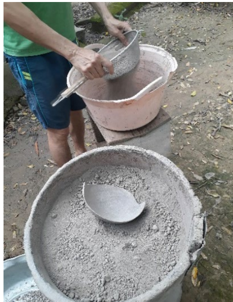
Fotografía 10. Eduardo Sandoval cerniendo el polvo de barro.