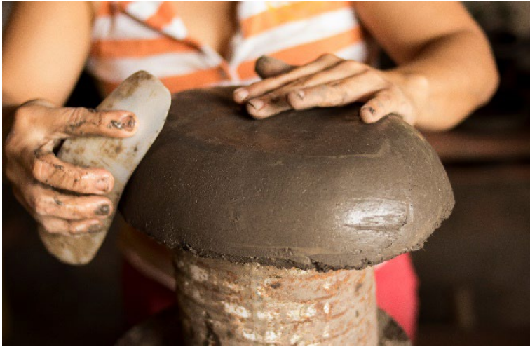
Fotografía 30. Relisar.