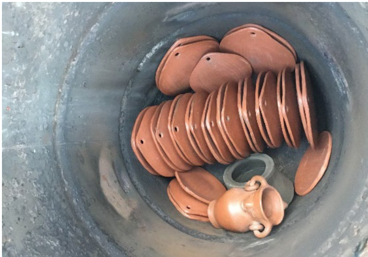
Fotografía 39. Loza acomodada por Alba Doris.