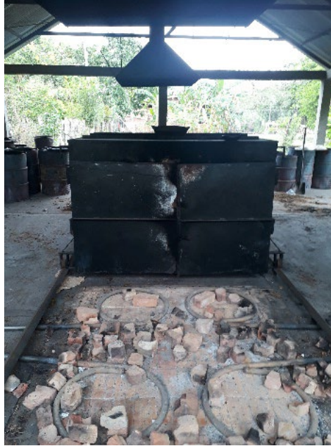
Fotografía 49. Horno de gas del sector de Artesanías.

cagajón y la leña. Otra persona lleva carretillas y platones sobre los cuales se ponen las obras listas para trasladarlas al lugar de su almacenamiento, en el taller o en algún anexo. Cuando se trata de ollas de tapa, tienen que probar qué tapa tiene una medida adecuada para cada olla.