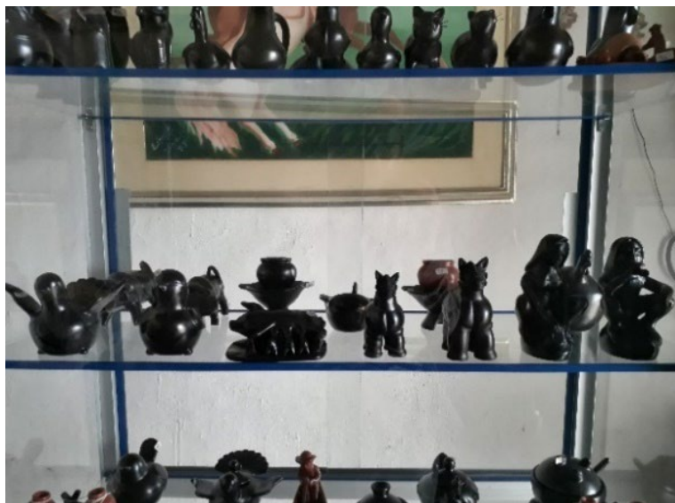
Fotografía 18. Figuras en el almacén de Eduardo y Lidia Sandoval.