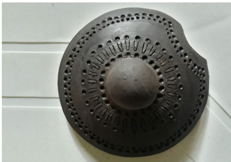
Fotografía 31. Tapa de ajicera decorada con repujadores.