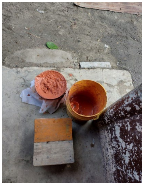
Fotografía 8. Barniz colado con cedazo.