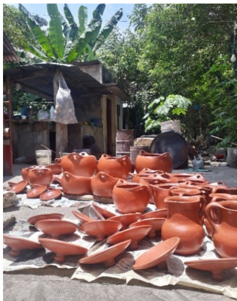
Fotografía 36. Loza de Nancy Betancourt botada al sol.