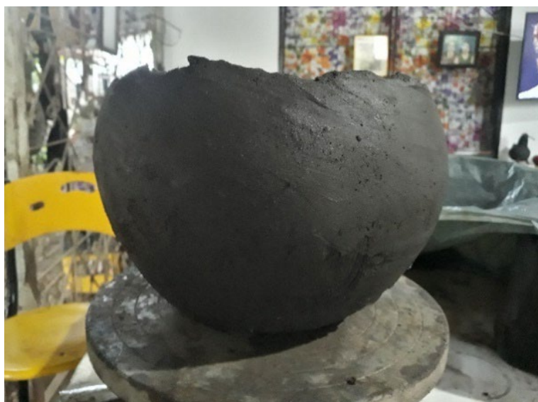
Fotografía 54. Un ensayo.