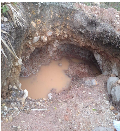
Fotografía 6. Mina de barniz.