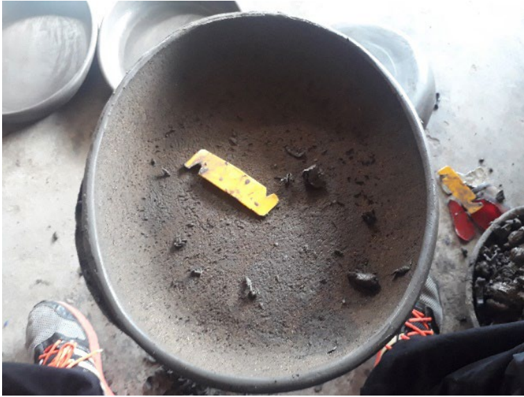
Fotografía 28. Cortador después de redondear.