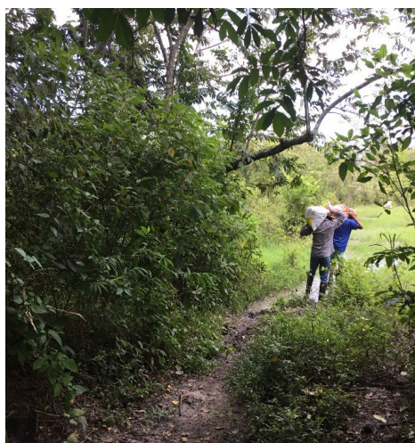
Fotografía 4. Cargar puchos de barro.