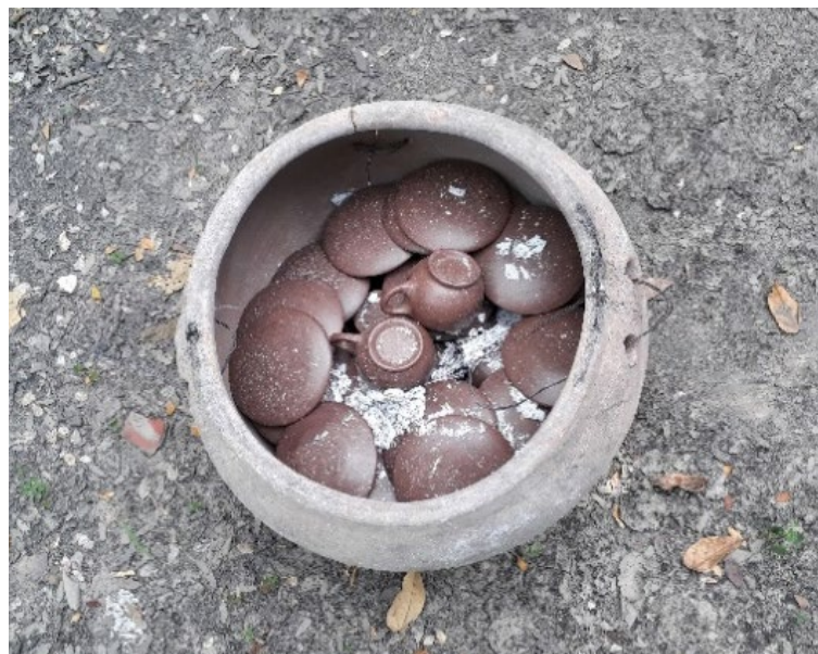
Fotografía 44. Loza asada, colorada.

La artesana, que ha estado pendiente, acomodando y ayudando, ha alistado el cagajón . Es estiércol de vaca o caballo. En el tiempo de antes fue el de los burros que acompañaban tantas tareas del