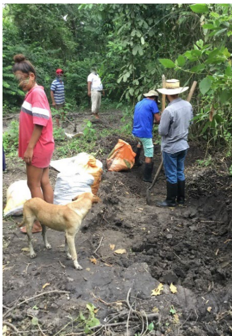
Fotografía 1. Sacar barro.