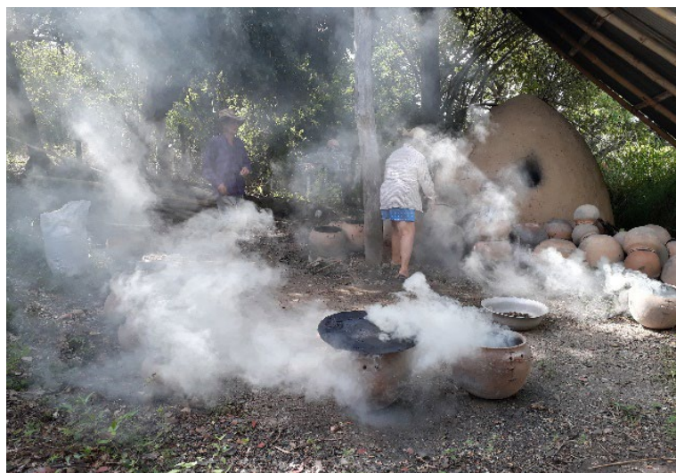
Fotografía 48 Gachones tapados para ahumar en el horno de Lidia y Eduardo Sandoval.