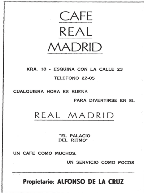
Figura 1: Café Real Madrid