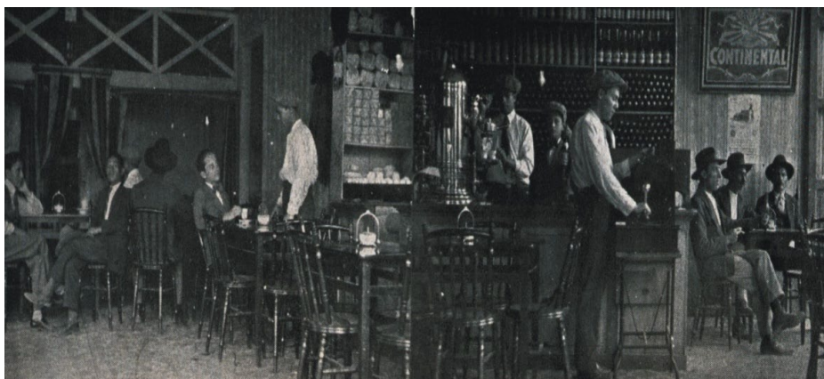
Fotografía 1: Café Madrid