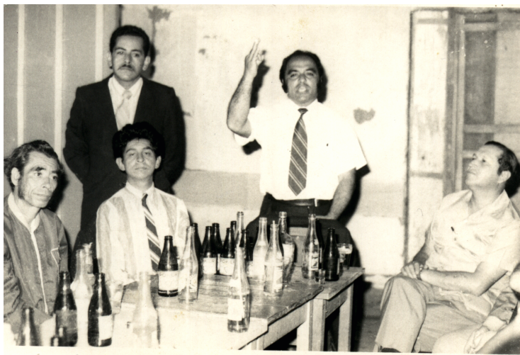
Fotografía 2: Personalidades del periodismo y la política local que cumplieron un importante papel durante el periodo de la Violencia.

liberales y periodistas, los últimos fueron quizás quienes más sufrieron durante el periodo de La Violencia.