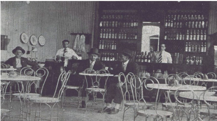
Fotografía 3: El Café Cádiz fue un lugar privilegiado para realizar negocios.

Dada la ola de amenazas, boleteos y asesinatos tanto de liberales como conservadores, en los diversos Cafés de la ciudad, los hombres se sintieron atemorizados y por tal razón visitaban estos establecimientos con menos frecuencia o sólo en determinadas horas del día. Esto no impidió, desde luego, que estos establecimientos cerraran sus puertas y sus propietarios dejaran de recibir dinero por sus ventas. De hecho, como lo señala el profesor Ortiz: “en cuanto comerciantes, liberales o conservadores, la Violencia no los perjudicó; al contrario, fueron beneficiados por el movimiento comercial que, en esos años, fue intenso en sus municipios” (Ortiz, 1985, p. 300).